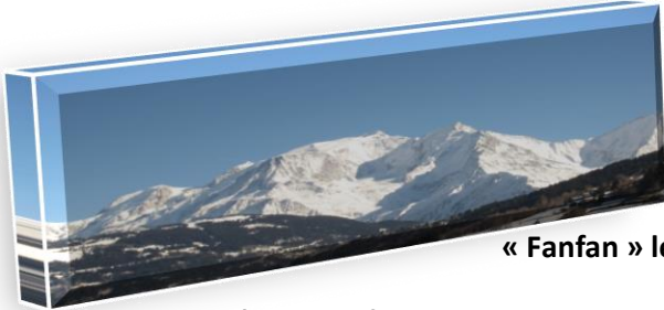
« Fanfan » le poisson qui rêvait de gravir le Mont-Blanc.