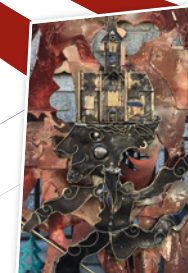
3 Sculpture des 80ans

Le clown est une bulle de savon, il faut savoir le prendre à la légère. Devant l'école publique