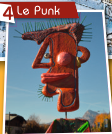
4 Le Punk

L'intelligent doute, le punk jamais. Rond-point des Rafforts