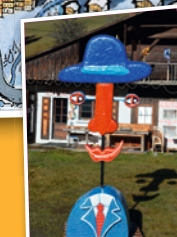
7 Gros Pif

On est tous des indiens de toutes les couleurs Devant les caisses des remontées mécaniques