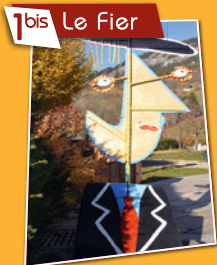
1bis Le Fier

C'est sur ce lilas que tu m'as donné ta fleur marguerite. Place de l'église