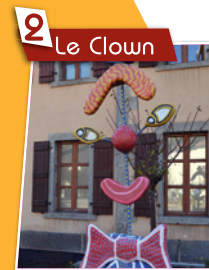
2 Le Clown

Je suis un fier dans le ruisseau, j'ai eu beaucoup de mal à monter sur le trottoir. Place de l'église