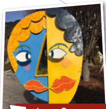
1 Les Amoureux

C'est sur ce lilas que tu m'as donné ta fleur marguerite. Place de l'église