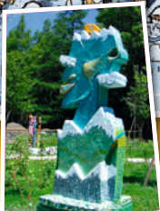
5 Homme des Cimes

L'intelligent doute, le punk jamais. Rond-point des Rafforts